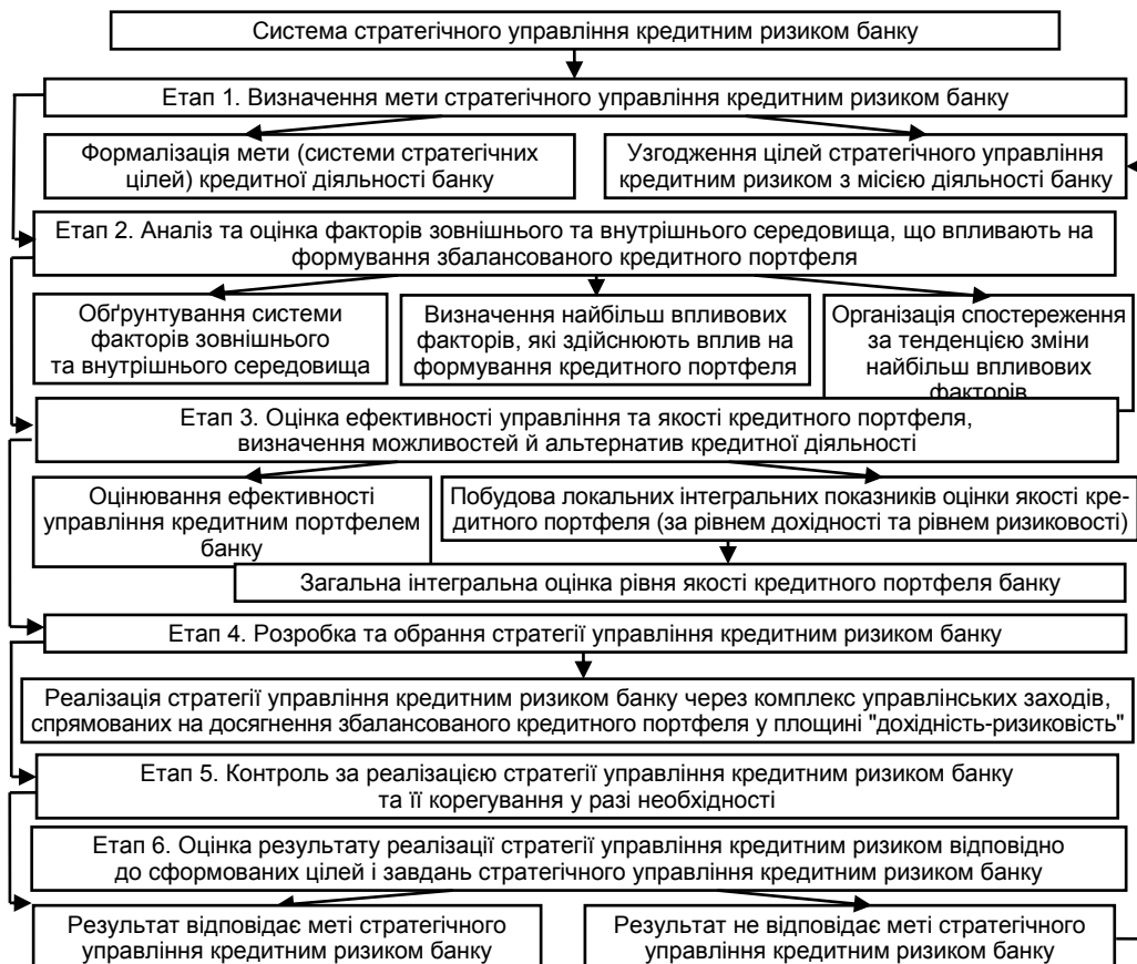
Рис. 2. Система стратегічного управління кредитним ризиком банку [4]

Згідно з рис. 2 першим етапом у системі стратегічного управління кредитним ризиком банку є етап постановки цілей, які слугують основним орієнтиром у ході планування кредитної діяльності у довгостроковій перспективі.