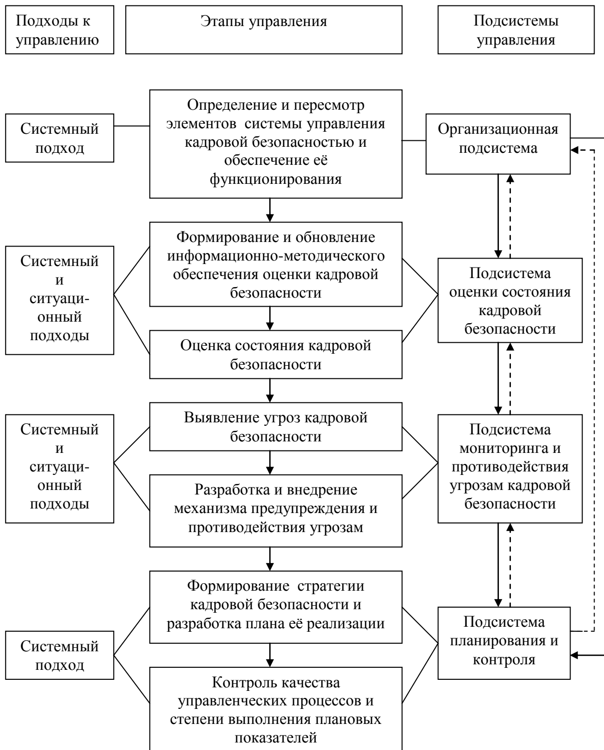
Рис. 1. Схема оптимизации процесса управления кадровой безопасностью предприятий

аспекты и подсистемы кадровой безопасности. В тоже время возникновение угроз кадровой безопасности носит ситуационный характер. Учитывая эти факторы целесообразным будет построение процесса управления кадровой безопасностью бизнес-единиц микроуровня на основании рационального сочетания системно и ситуационно ориентированного управления (рис. 1).