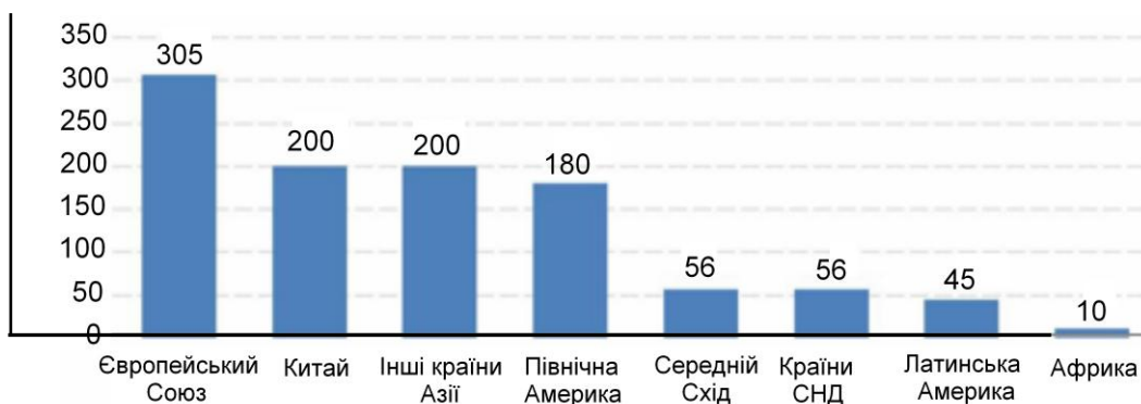
Рис. 2. Заплановані середньорічні обсяги інвестицій в інфраструктуру в 2010–2020 рр., млрд дол. США

Для розвитку виробничої інфраструктури агросфери важливими є обсяги нарощення будівництва нових об'єктів та ремонт існуючих. Наразі Україна не має змоги піднятися до рівня інвестування інфраструктурних проектів розвиненими державами. Заплановані середньорічні обсяги інвестицій в інфраструктуру на 2010 – 2020 рр. (рис. 2) свідчать про те, що частка всіх інвестиційних ресурсів, які припадають на країни пострадянського простору, майже вшестеро менше від вкладень у розвиток інфраструктури країн Євросоюзу [5, с. 69].