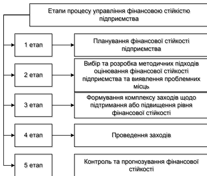
Рис. 2. Етапи процесу управління фінансовою стійкістю підприємства

Під плануванням фінансової стійкості підприємства розуміється визначення цілей фінансової стійкості, шляхів її розвитку, а також формування основних напрямів розвитку. На другому етапі здійснюється вибір та розробка методичних підходів оцінювання фінансової стійкості підприємства, а також виявлення проблемних місць. На третьому етапі формується комплекс заходів щодо підтримання або підвищення рівня фінансової стійкості. Наступним кроком ці заходи реалізуються на практиці. Останнім етапом проводиться аналіз та оцінка отриманих результатів від втілення рекомендацій, критичних точок розвитку фінансової системи та встановлення майбутнього рівня фінансової стійкості підприємства.