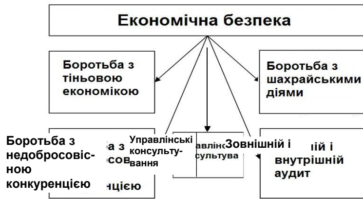
Рис. 1. Економічна безпека держави (узагальнено автором на основі роботи [3])

На думку світової спільноти, сталий розвиток не має розумної альтернативи. Можна вважати, що це єдиний прийнятний для людства шлях у майбутнє. Швидке усвідомлення загроз, пов'язаних із руйнуванням навколишнього середовища; адекватна реакція на соціально-екологічну кризу; прорив до нового світорозуміння і нової системи цінностей; широке міжнародне партнерство на базі кооперації та фінансової допомоги слаборозвиненим країнам – ось найбільш істотні відмітні його моменти [4].