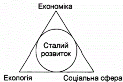
Рис. 2. Складові концепції сталого розвитку

Складові концепції сталого розвитку поділяють на три групи: економічна складова; соціальна складова; екологічна складова (рис. 2).