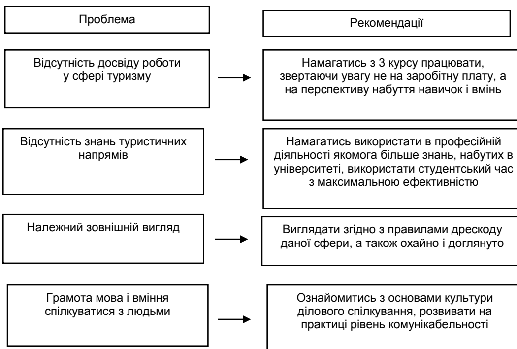
Рис. 2. Рекомендації при працевлаштуванні студентів і випускників сфери туризму

За результатами проведеного дослідження оголошень про пошук роботи були виявленні проблеми і розроблені деякі рекомендації щодо працевлаштування в сучасних умовах на прикладі студентів і випускників за спеціальністю туризм на рис. 2.