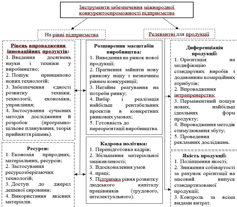
Рис. 2 - Інструменти забезпечення міжнародної конкурентоспроможності підприємства

підхід до поділу на високо- і низько-технологічні галузі характеризує їх з точки зору участі в розробці технологій, а не в їх застосуванні. Тоді як для модернізації економіки важливо й те, й інше: навіть низько-технологічне за поданою класифікацією підприємство може бути оснащено останніми нововведеннями сфери машинобудування та електроніки, що забезпечують йому конкурентні переваги.