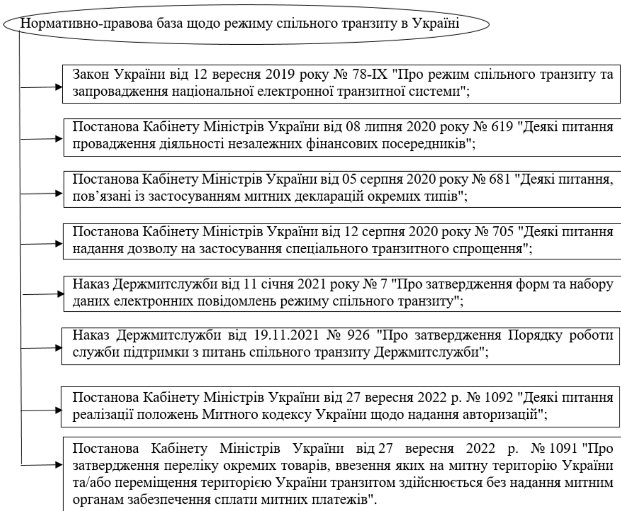
Рис.1 – Нормативно-правова база спільного транзиту (NCTS)

Як видно на рис.1, було запроваджено декілька постанов Кабінету Міністрів України та Держмитслужби України, які встановлюють основні засади організації та здійснення режиму спільного транзиту товарів митною територією України, порядок і умови переміщення таких товарів підприємствами митною територією України в режимі спільного транзиту, здійснення митних формальностей, застосування механізму гарантування сплати митного боргу, застосування спеціальних транзитних спрощень та інші особливості здійснення операцій режиму спільного транзиту.