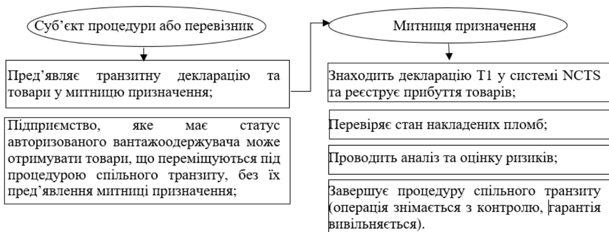
Рис.3 – Завершення процедури спільного транзиту в митниці призначення

На рис. 3 зображено завершення процедури спільного транзиту в митниці призначення.