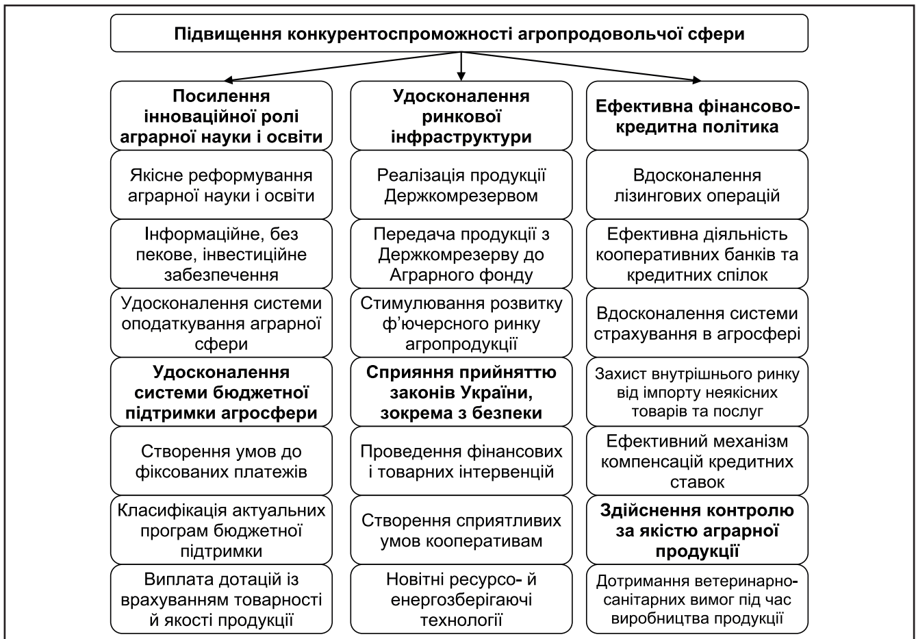
Рис. 2. Актуальні завдання держави з підвищення конкурентоспроможності агропродовольчої сфери

Узагальнено авторами на основі [3; 5; 11]