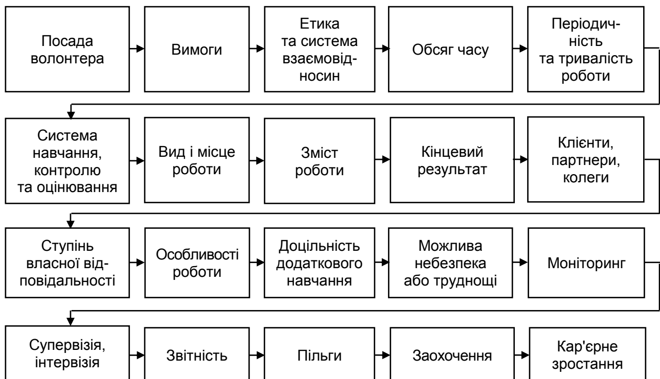
Рис. 5. Орієнтовна структура описання змісту волонтерської діяльності