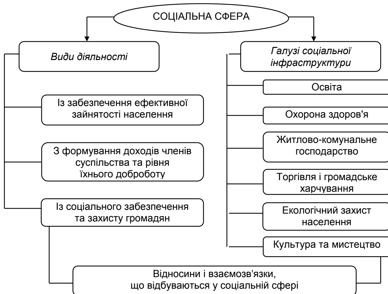
Рис. 1. Структура соціальної сфери

що спільного та відмінного понять "соціальна сфера" та "соціальна інфраструктура".