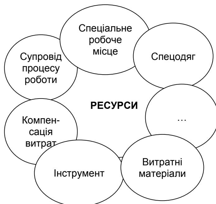
Рис. 6. Приблизний перелік ресурсів, необхідних для роботи волонтерської організації