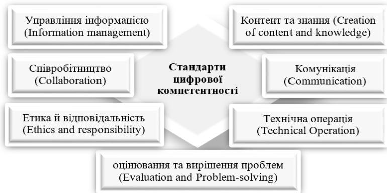
Рисунок 2 – Стандарти цифрової компетентності згідно EUROPASS