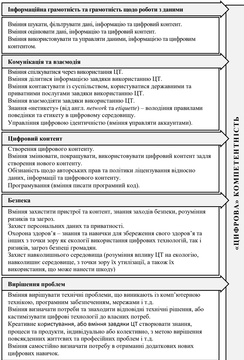
Рисунок 1 – Контентне наповнення Digital Competence 2.0