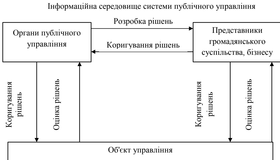
Рис. 1.2. Комунікаційних процес в системі публічного управління

досвідом» в чистому вигляді. Головна умова ефективного спілкування - правильне сприйняття, а не інформаційна насиченість 25 .