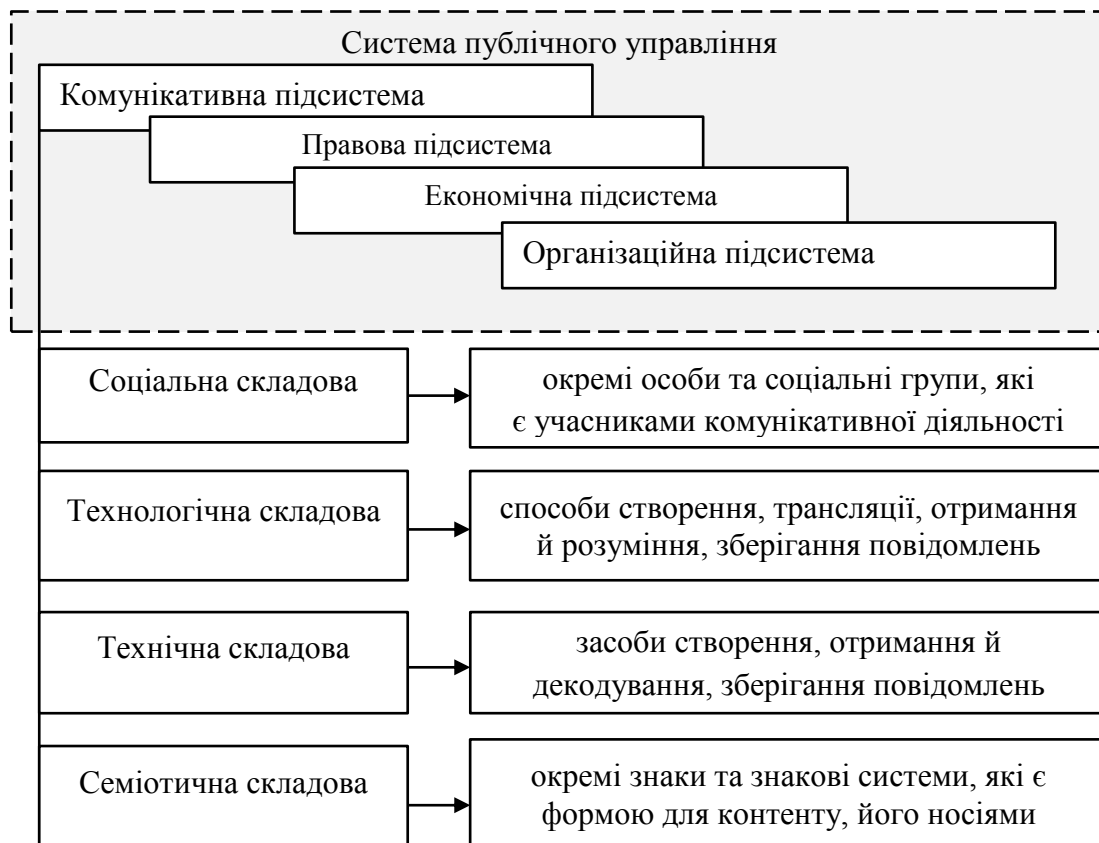
Рис. 1.1. Складові комунікативної підсистеми публічного управління

З позицій структурно-функціонального розгляду комунікативної підсистеми публічного управління та комунікативної діяльності в публічному управлінні можемо виділити чотири притаманні їм основні складові (підсистеми) 20 (рис. 1.1.)