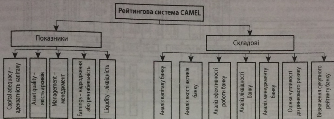
Рис. 1. Структурна декомпозиція рейтингової системи CAMEL

Системи і методи контролю забезпечують ефективно дотримання основних напрямів політики банку. Керівництво банку також підлягає оцінці з позиції дотримання банком установлених законів і правил.