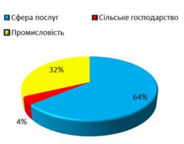
Рис. 1. Структура розподілу ВВП за секторами економіки у 2019 р.

За даними [2], існують домінуючі види економічної діяльності за їх внеском до формування ВВП країн, а саме: сільськогосподарський сектор, промисловий, та сектор послуг. Співвідношення секторів економіки за внеском до ВВП країни представлено на рис. 1.