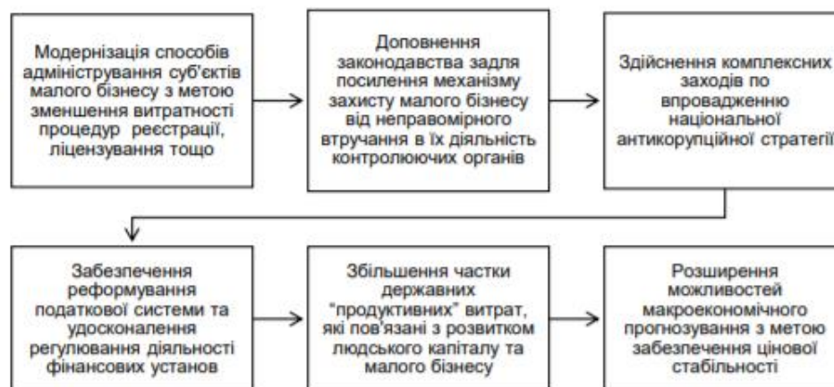
Рис. 1.6. Пріоритетні завдання регулювання трансакційних витрат малого бізнесу (складено на основі [2])

Реалізація таких заходів регулювання непрямым чином сприяє оптимізації даних витрат. При цьому, в умовах реформування національної економіки України, пріоритетні завдання представлені на рис. 1.6.