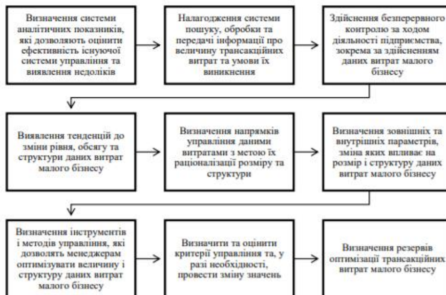
Рис. 1.8. Алгоритм управління трансакційними витратами суб'єктів малого бізнесу (складено на основі [6])

Таким чином, використання ефективного механізму управління трансакційними витратами, що враховує інституційні умови виникнення і існування в економіці, дозволяє управляти даними витратами та оптимізувати їх величину, що, в свою чергу, позитивно вплине на прибуток підприємства. Як вже було з'ясовано, основною метою управління трансакційними витратами є забезпечення їх оптимальних обсягів і структури. В такому випадку, оптимальними є такі витрати, які навіть за умови зростання забезпечують приріст доходу та прибутку. До них можна віднести формальні інститути – діюче законодавство, неформальні інститути – норми та звичаї, розвиток та використання ІКТ та інституційне середовище – якість правових норм, ефективність судової системи, державне регулювання тощо.