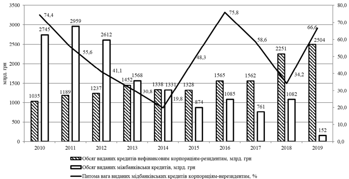
Рис. 2. Обсяги кредитування реального сектору економіки України порівняно з міжбанківськими кредитами

Аналізуючи рис. 5 можна побачити, що кредитна заборгованість корпоративних клієнтів в абсолютному розмірі поступово зменшується, але в умовах знецінення національної валюти зниження її реальної вартості є суттєвим. Питома вага заборгованості юридичних осіб у кредитному портфелі з 2011 року коливається в межах 75-85%, частка заборгованості юридичних осіб у сукупних активах банків з 2014 року зменшується стійкими темпами.