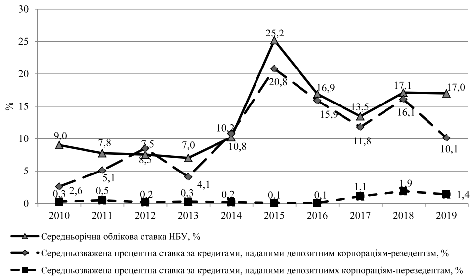
Рис. 4. Динаміка процентних ставок за міжбанківськими кредитами