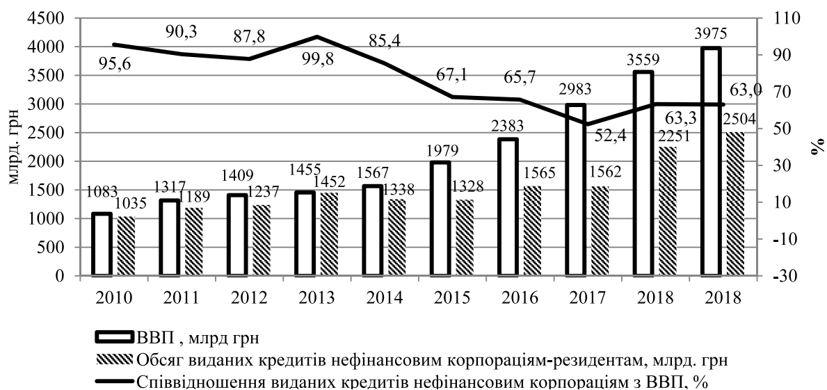
Рис. 1. Обсяги кредитування реального сектору економіки України порівняно з номінальним ВВП

Аналіз співвідношення обсягів кредитування реального сектору економіки України з міжбанківським кредитуванням (рис. 2) свідчить про позитивну тенденцію зниження позикового фінансування банків, однак виникає питання доцільності надання міжбанківських кредитів банкам-нерезидентам в умовах високого внутрішнього попиту на фінансові ресурси.