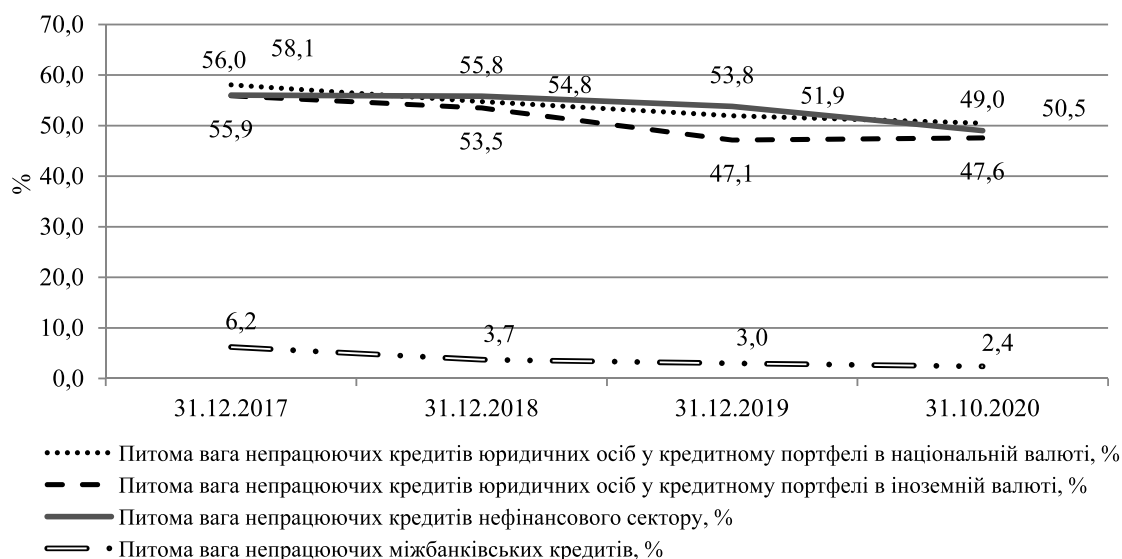
Рис. 6. Динаміка питомої ваги непрацюючих кредитів юридичних осіб

рема недостатню їх деталізацію відносно нерезидентів, відсутність взаємопов'язаності між звітністю: у звітах використовуються різні класифікації позичальників, перехресні дані не співпадають. Велика кількість форм ускладнює розуміння аналітичної інформації. Для підвищення прозорості діяльності банківського сектору, реального структурування статистичних даних, прискорення їх аналізу в умовах цифровізації економіки доцільно оприлюднення агрегованої інформації НБУ на аналітичних панелях Power BI [14]. Бізнес-аналітика в Power BI дозволить НБУ, банківським установам і широкому колу зацікавлених осіб здійснювати моніторинг стану кредитного ринку й оцінювати вплив на нього заходів грошово-кредитного регулювання.