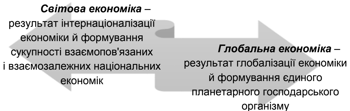
Рис.1. Поняття "світової" та "глобальної" економіки

Слід відмітити, що світова економіка та глобальна економіка є різними поняттями (рис. 1).