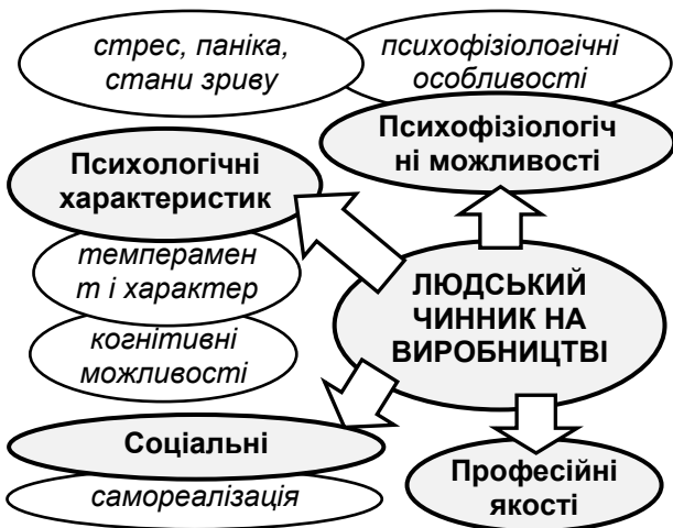
Рис. 1 – Багатоаспектність проблематики людського чинника

Очевидно, що проблема безпеки виробництва набагато глибша і знаходиться на перетині площин соціальної та індивідуальної свідомості, психології учасників, соціальної та індивідуальної поведінки та індивідуальних психофізіологічних особливостей людини (рис. 1).