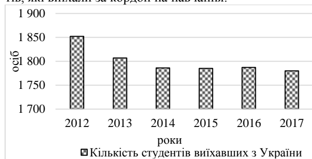
Рис. 3. Кількість студентів, які виїхали на навчання за кордон за період 2012-2017 роки

Однією з причин зниження кількості студентів у ЗВО України є виїзд студентів на навчання за кордон. Протягом останніх десяти років найбільша кількість студентів виїхало на навчання до Польщі, Словаччини, Угорщини, Чехії. Вдтік українських громадян за кордон з метою здобуття вищої освіти є негативною тенденцією для розвитку нашої країни. Проте, за останні роки за даними Державної служби статистики України [6], наша Помилка! Джерело посилання не знайдено. держава нарощує позиції як країна, що надає освітні послуги іноземним студентам, тобто на даному етапі вона виступає в якості країни-донору, постачальника освітніх мігрантів в інші країни. Це можна пов'язати з тим, що зростає рівень доступності здобуття вищої освіти за кордоном, розширюється географія міжнародних зв'язків та співпраця вітчизняних ЗВО зі закордонними університетами, поглиблюються політичні та економічні зв'язки нашої держави з країнами Європейського союзу. На рис. 3 представлено кількість студентів, які виїхали за кордон на навчання.