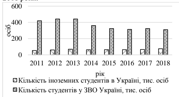
Рис. 1. Динаміка кількості студентів в Україні за період 2011-2018 роки

Збільшення мобільності залежить від приєднання країн до наддержавних об'єднань, тобто студенти Європи можуть вільно пересуватись між країнами з метою отримання освіти. Характерними рисами освітньої міграції є її добровільний, масовий, соціокультурний та короткостроковий характер, чітко визначені строки перебування за кордоном (період навчання, здобуття освіти), вікові обмеження та мета виїзду за кордон: отримання професійної освіти, проходження стажувань та практик, проведення наукових досліджень. На рис. 1 представлено кількість студентів всього та іноземних студентів прийнятих на навчання в ЗВО України за період 2011-2018 роки.