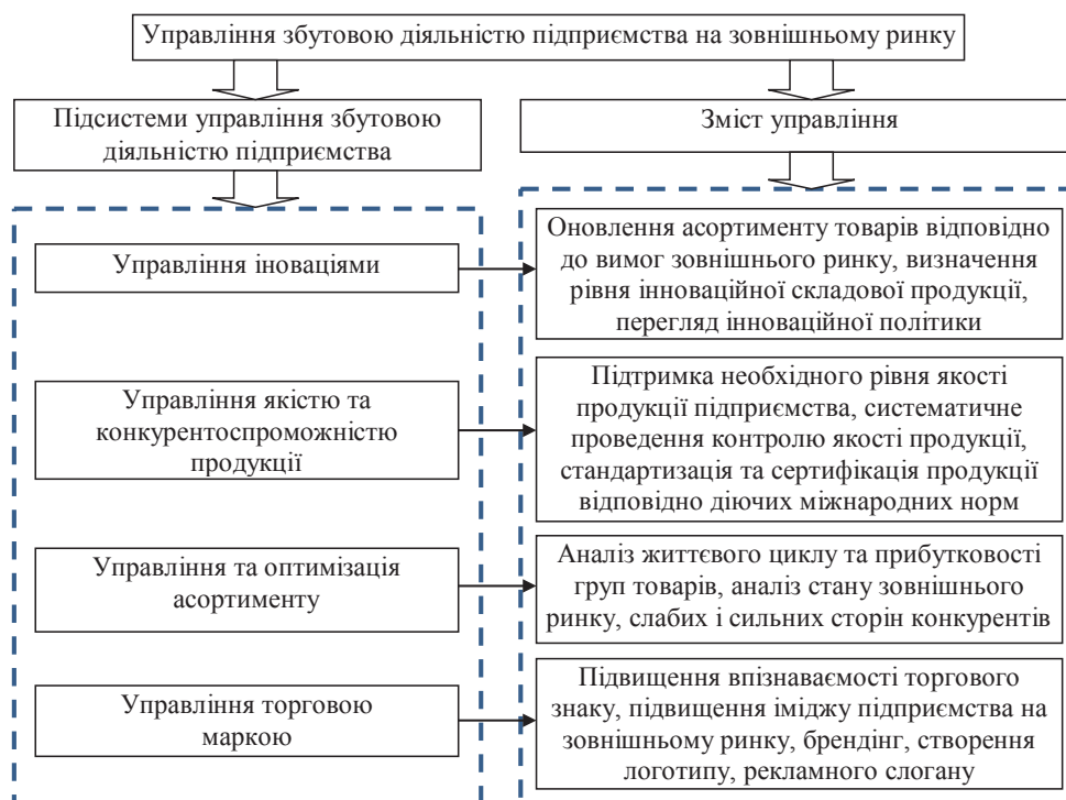
Рис. 1. Підсистеми управління збутовою діяльністю підприємства на зовнішньому ринку