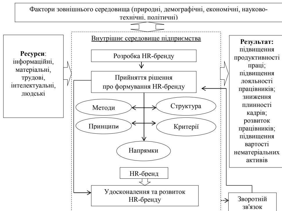
Рис. 2. Система HR-бренду на підприємстві

розроблення ціннісної пропозиції співробітнику і роботодавцю;