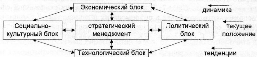
Рис. 1. Система структурных блоков внешней среды, формирующих стратегический менеджмент

В общем виде система факторов внешней среды влияния, формирующих стратегический менеджмент предприятия и порядок их взаимодействия, схематически имеет следующую структуру: