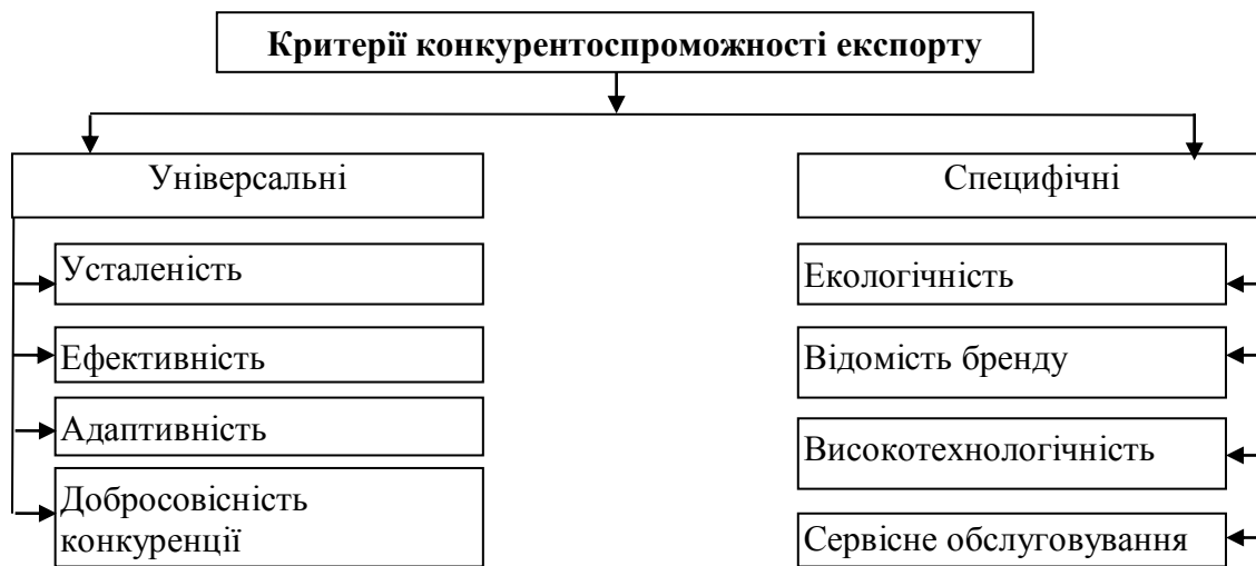
Рис. 2. Сучасні критерії конкурентоспроможності експорту підприємства

Сучасний стан світогосподарських зв'язків та поглиблення процесів глобалізації спричинили необхідність виокремлення крім універсальних ще й специфічних (додаткових) критеріїв конкурентоспроможності експорту (рис. 2) [5].