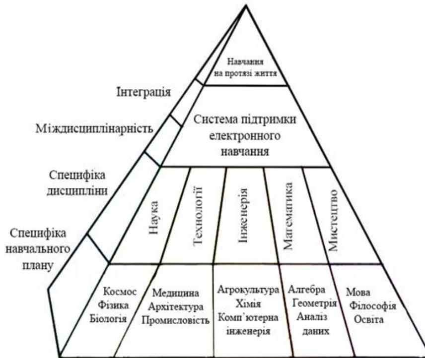
Рис. 1. Схема педагогічної парадигми неперервного навчання на протязі життя

Найважливіша передумова міждисциплінарного підходу в педагогіці пов'язана з особливостями досліджуваної об'єктивної реальності, яка виражається в комплексності досліджуваних процесів і явищ або точніше комплексності «мінімального задовільного зображення» досліджуваного явища в предметі дослідження [5]. Освітні інститути, процеси і середовища як вектори, що задають простір об'єктивної педагогічної дійсності, змістовно об'єктивують таку характеристику як комплексність педагогічних об'єктів вивчення. Комплексність досліджуваних явищ детермінує міждисциплінарні синтетичні дослідження, в яких об'єкт вивчення фіксується в різних предметних проєкціях і описується в різних моделях наукового пізнання з метою отримання цілісного знання про феномени педагогічної реальності.