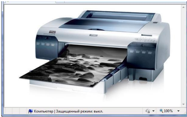
Рис.4. Результат прийняття рішень стосовно вибору виду обладнання для флексографічного друку етикеточної продукції

Отже, отримані результати виявлення взаємозв'язку між критеріями та використовуваним обладнанням, у вигляді класифікації підприємства, лягли в основу побудови прототипу СППР «Вибір обладнання для флексографічного друку».