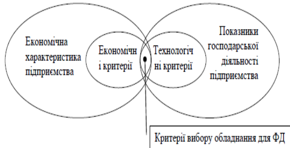
Рис.2. Область визначення критеріїв вибору обладнання для ФД

Для досягнення поставленої мети дослідження та забезпечення повноти оцінки можливих варіантів вибору обладнання передбачається врахування усіх виявлених критеріїв, тобто показників економічної та технічної групи, які показані на рис.2.