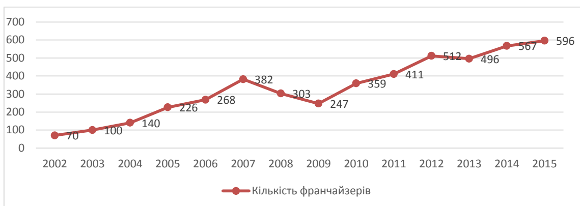
Рис.3. Аналіз зміни кількості франчайзерів в Україні 2002-2015 роки

Франчайзинг дедалі ширше використовується різними фірмами, наприклад «ТНК-Україна», «Лукойл-Україна», «АТЛ», «SPAR», «1С» і «МакСмак» та інші. Кількість франчайзерів в Україні щорічно збільшується (рис. 3).