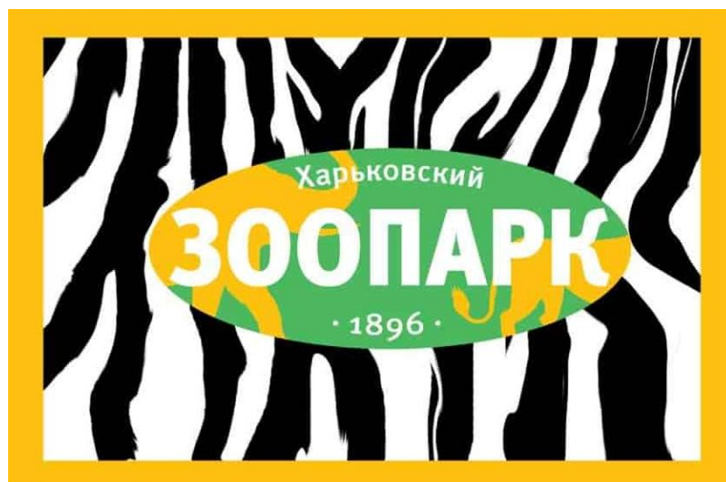
Рис. 2 Розроблений логотип

Дослідивши ситуацію, яка склалася на підприємстві – падіння кількості відвідувачів, зниження рівня зацікавленості з боку потенційних клієнтів, збільшення видатків з місцевого бюджету на утримання зоопарку, було вирішено розробити новий фірмовий стиль, який відповідав би справжньому потенціалу компанії. Насамперед були визначені фірмові кольори. Виходячи з опитування харків'ян, було визначено з якими кольорами асоціюється в них зоопарк. Домінує зелений (75 %), який асоціюється з природою та спокоєм, на другому місці – жовтий колір (15 %), що асоціюється з яскравими емоціями, сонцем. Була розроблена серія логотипів (рис. 2), що мають спільний зміст та схожу форму, єдність досягається єдиним текстом, а щоб зобразити різноманітність зоопарку були обрані силуети тварин-образів зоопарку – слон, якого вважають символом 13 % опитаних та лев (9 %).