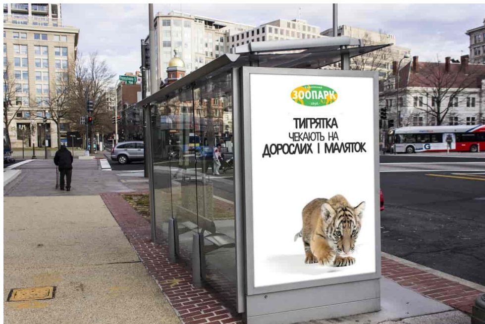
Рис. 8 Розроблений сітілайт №2