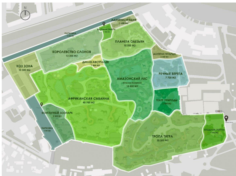
Рис. 1 План реконструкції та зонування Харківського зоопарку

вибірка обумовлена аналізом цільовою аудиторією зоопарку). Що стосується «Досвіду використання бренду» та «Сили переконання» – 31% опитуваних відвідав зоопарк в цьому році, 30,7% - у минулому; хотіли б порекомендувати піти до харківського зоопарку своїм друзям 28,8% респондентів, скоріше порекомендували б, ніж ні – 43%. Такий елемент бренду, як «Ім'я і репутація» є зоною для розвитку, адже 44% опитуваних оцінюють роботу Харківського зоопарку на 3 бали з 5. Варто зазначити, що 90% опитуваних не знає, як виглядає логотип зоопарку, а це вже серйозний недолік «Зовнішнього аспекту» бренду. Пункт «Емоційні підстави» у процесі опитування показав серйозні проблеми у комунікації з клієнтами, адже 29,9% опитуваних на сьогодні мають серйозні претензії до поводження з тваринами у зоопарку, що зробило їхній відпочинок незадовільним та незручним. Ця ситуація повинна виправитися після реконструкції та оновлення умов утримання мешканців зоопарку. Проект реконструкції «Харківського зоологічного парку» був затверджений світовою спільнотою та оцінюється в 11 млн євро, роботи вже розпочалися та їх завершення планується на початку 2018 року. (Рис.1)