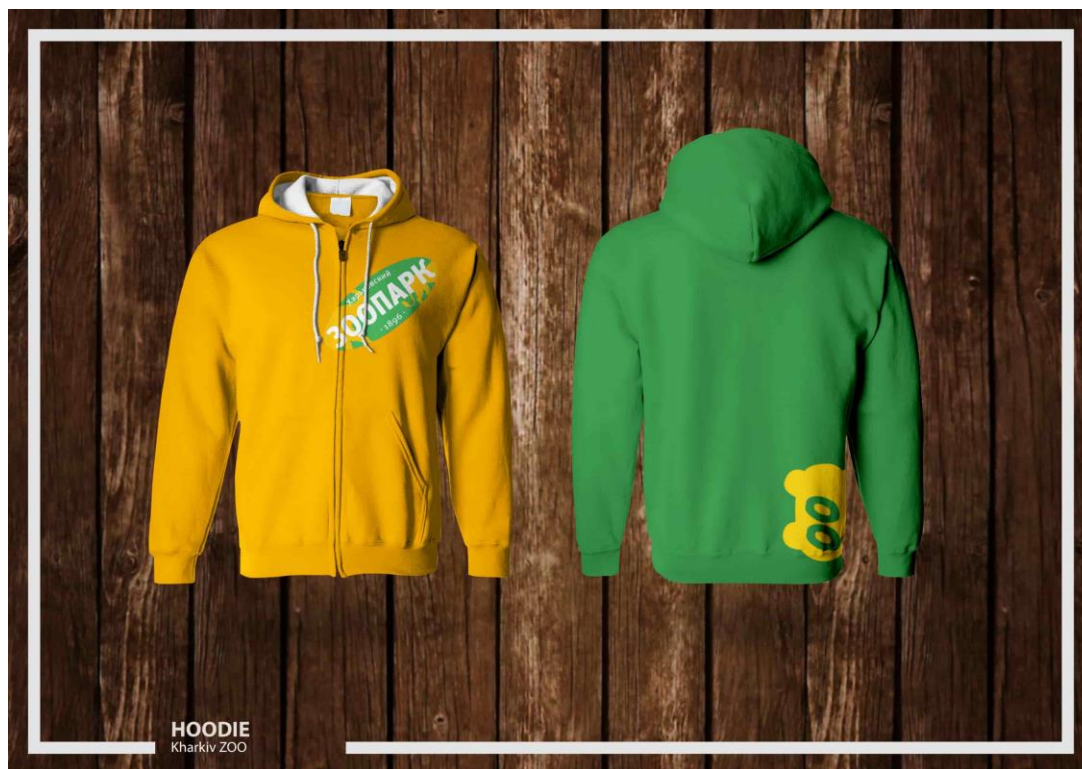
Рис. 3 Розроблений худі

Були також розроблені наступні елементи фірмового стилю: логотип, фірмові кольори, шрифт. Розроблені елементи зовнішньої реклами: білборди, рекламні установки, транспортна реклама. А також інші елементи: сумки, футболки, та фірмовий одяг. (рис. 3, 4)