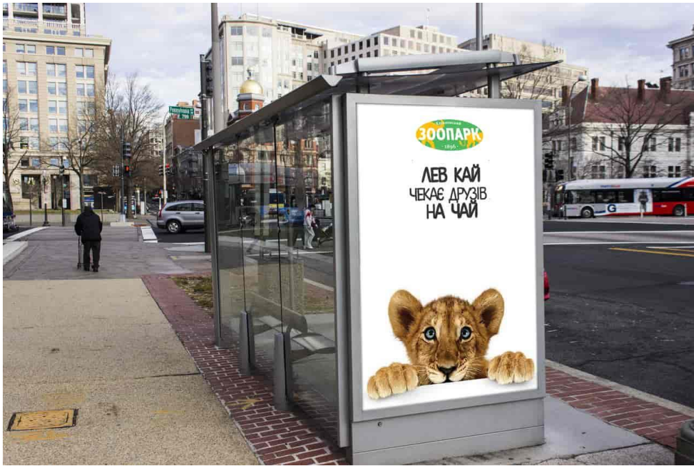
Рис. 7 Розроблений сітілайт №1