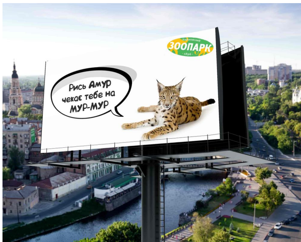
Рис. 9 Розроблений білборд

Висновки з проведеного дослідження. Таким чином, створення бренду комунальної організації «Харківський зоологічний парк» допоможе вирішити проблему сталого розвитку туристичної перлини Харківщини. Бренд забезпечить захист товару від атак конкурентів і зміцнить позиції щодо товарів-замінників.