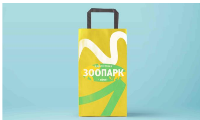
Рис. 4 Розроблений фірмовий пакет

У сучасному світі, аби досягнути успіху в бізнесі, недостатньо просто виробляти якісні товари, засновані на новітніх технологіях і встановлювати прийнятні для цільових покупців ціни на них. Необхідно донести до споживачів відповідну інформацію, як про самі товари і послуги, так і безпосередньо про переваги відпочинку у зоопарку. Бренд-меседж зоопарку,