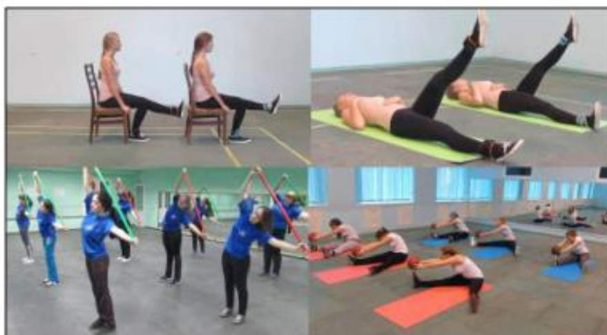
Рис. 1. Кадры видео уроков по физической реабилитации

Студентам группы реабилитации были предложены видео уроки по методам развития физических качеств, где раскрываются термины и понятия физических качеств человека, излагаются особенности обучения двигательным действиям в группе физической реабилитации. Кроме теории в пособие даны фото упражнений и видео комплексов специальных заданий, а также подвижных игр, выполняемые студентами группы физической реабилитации нашего вуза. Все средства для развития физических качеств подобраны для студентов с различными заболеваниями, где особое внимание уделяется исходному положению, правильному выполнению упражнений и дыханию (рис. 1).