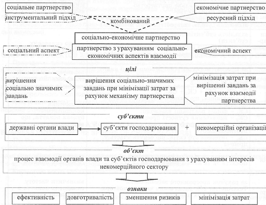
Рис. 1. Схема предметної сфери формування соціально-економічного партнерства

Висновки. Нині соціально-економічне партнерство держави та суб'єктів господарювання є одним із факторів стійкого розвитку економіки, важливим аспектом зміцнення державної влади,