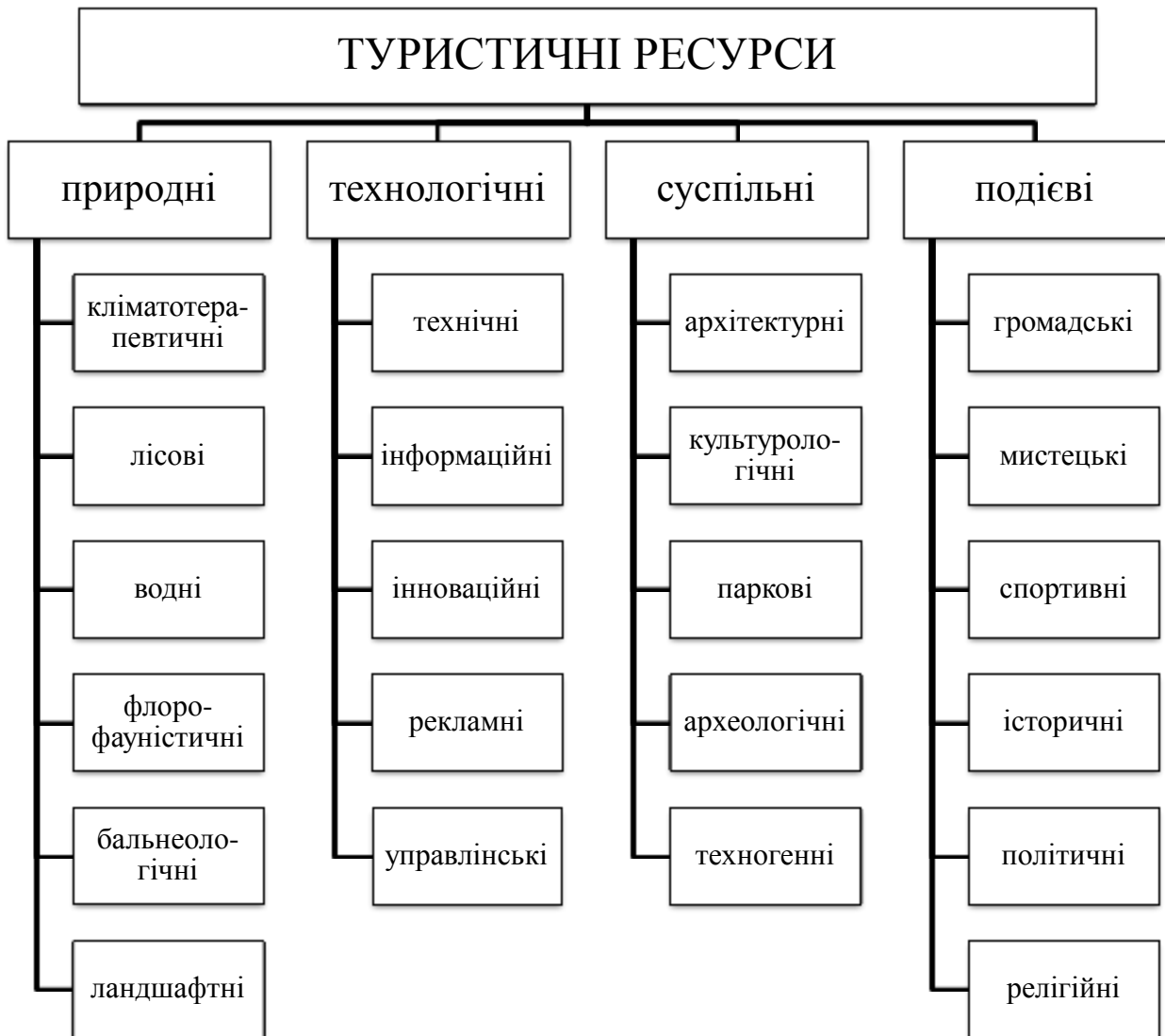
Рис. 1. Структура туристичних ресурсів

Для визначення потенціалу розвитку симбіозу таких видів туризму як екологічного та етнічного була обрана структура туристичних ресурсів І. Смалю, а також вирішено використовувати методіку експертного оцінювання Т.Сааті, відповідно до якої фахівцям туристичної галузі різних регіонів України було запропоновано визначити вагу таких видів туристичних ресурсів, як природні, технологічні, суспільні та події. Сутність методу американського вченого Т. Сааті полягає в тому, що передбачається попарне порівняння обраних альтернатив з метою виявлення найпривабливішої з них. Він містить в собі наступні етапи: