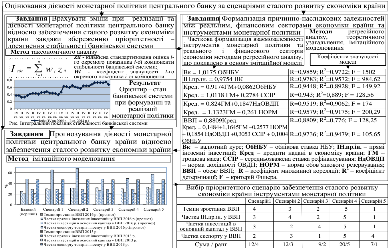
Рис. 4. Методичне забезпечення прогнозування сценаріїв сталого розвитку економіки країни з урахуванням впливу інструментів монетарної політики

Використання розробленого методичного забезпечення дозволило оцінити дієвість монетарної політики НБУ за такими сценаріями. Перший (базовий) передбачає відсутність змін у значеннях усіх інструментів монетарної політики НБУ. Другий сценарій представлений блоком сценаріїв, які характеризують зміну інструментів монетарної політики, що впливають на параметри сталого розвитку економіки країни (частку іноземних інвестицій у ВВП, частку інвестицій в основний капітал у ВВП, частку експорту у ВВП). Основними заходами за запропонованим блоком сценаріїв є такі: за першим – зниження облікової ставки НБУ до рівня розвинутих країн світу – 5%; за другим – збільшення дохідності ОВДП до 15,5%; за третім – зниження середньозваженої ставки рефінансування до 6,5%; за четвертим – зниження норм обов'язкового резервування до 1%; за п'ятим – поєднання заходів всіх попередніх сценаріїв. Для узагальнення результатів використано ранговий показник, який характеризує поліпшення кожного з аналізованих показників (темпи приросту ВВП, частка іноземних інвестицій у ВВП, частка інвестицій у основний капітал у ВВП, частка експорту у ВВП) в порівнянні з базовим сценарієм.