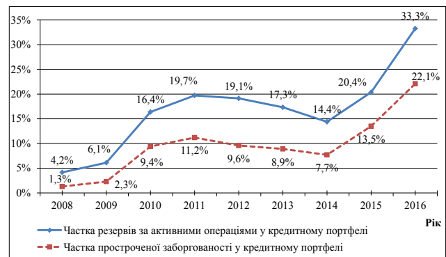
Рис. 3. Динаміка частки резервів за активними операціями та частки простроченої заборгованості в кредитному портфелі банків упродовж 2008–2016 рр. [1]

Стрімке збільшення частки проблемної заборгованості в кредитному портфелі банків зумовлює значні відрахування в резерви на покриття втрат за кредитними операціями. Чим більші суми відрахування в резерви під кредитні ризики водночас зі зростанням витрати банків на адміністрування проблемних кредитів, тим менш ефективно використовується банківський капітал. Проаналізуємо частку резервів за активними операціями та частку простроченої заборгованості у кредитному портфелі банків (рис. 3).