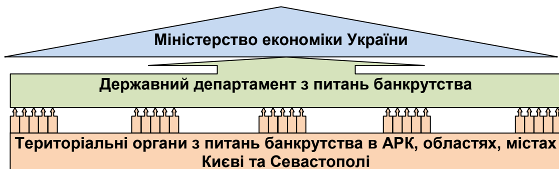
Рис. 1. Організаційна структура Департаменту

дворівневу структуру – складається з Департаменту, який знаходиться у м. Києві і представляє його центральний рівень та 25 територіальних органів з питань банкрутства: 5 управлінь в АРК й м. Севастополь, місті Києві, Харківській, Донецькій, Дніпропетровській областях; 6 відділів (Запорізька, Івано-Франківська, Миколаївська, Луганська, Львівська, Одеська області); 14 секторів у інших областях України. Департамент та його територіальні органи є юридичними особами, мають самостійні баланси, рахунки в установах банків, печатку із зображенням Державного герба України і своїм найменуванням.