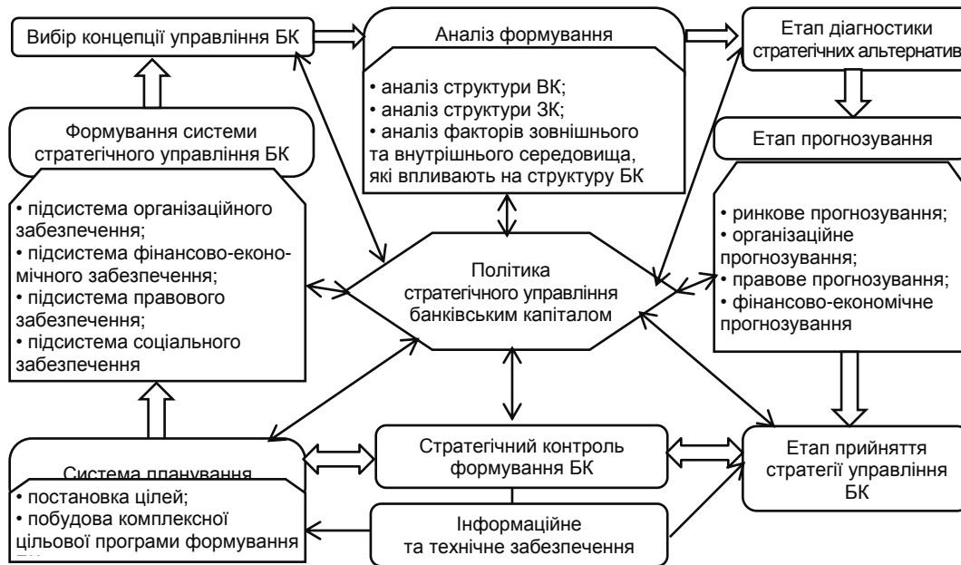
Рис. 2. Концептуальна схема комплексного підходу до стратегічного управління банківським капіталом

Комплексний підхід у банківському стратегічному управлінні є вживаним, він може давати вагомий результат, тому що ідеально лягає на банківську ідеологію. Тому найбільш вагомою рисою стратегії управління повинно стати розширення контуру управлінських рішень для отримання замкнутої, саморегулюючої системи, здатної гнучко та оперативно реагувати на зміни у банківському бізнес-середовищі (рис. 2).