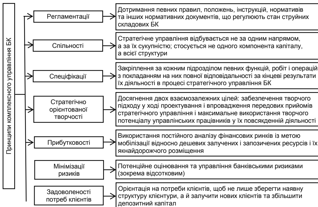
Рис. 3. Принципи комплексного управління банківським капіталом

Під час комплексного підходу до стратегічного управління капіталом можна рекомендувати використовувати певні принципи, яких повинні дотримуватися банківські установи (рис. 3).