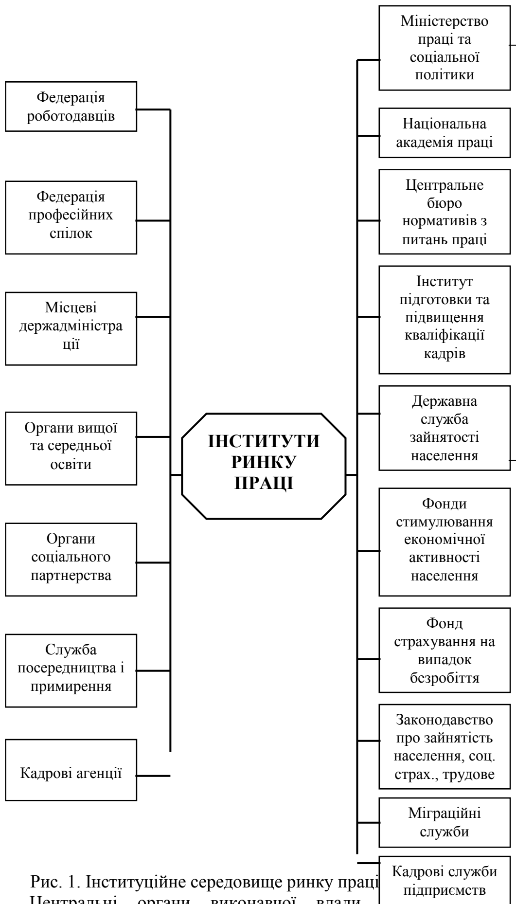
Рис. 1. Інституційне середовище ринку праці. Центральні органи виконавчої влади сформовані як функціонально універсальні одиниці державного управління. При такому механізмі управління