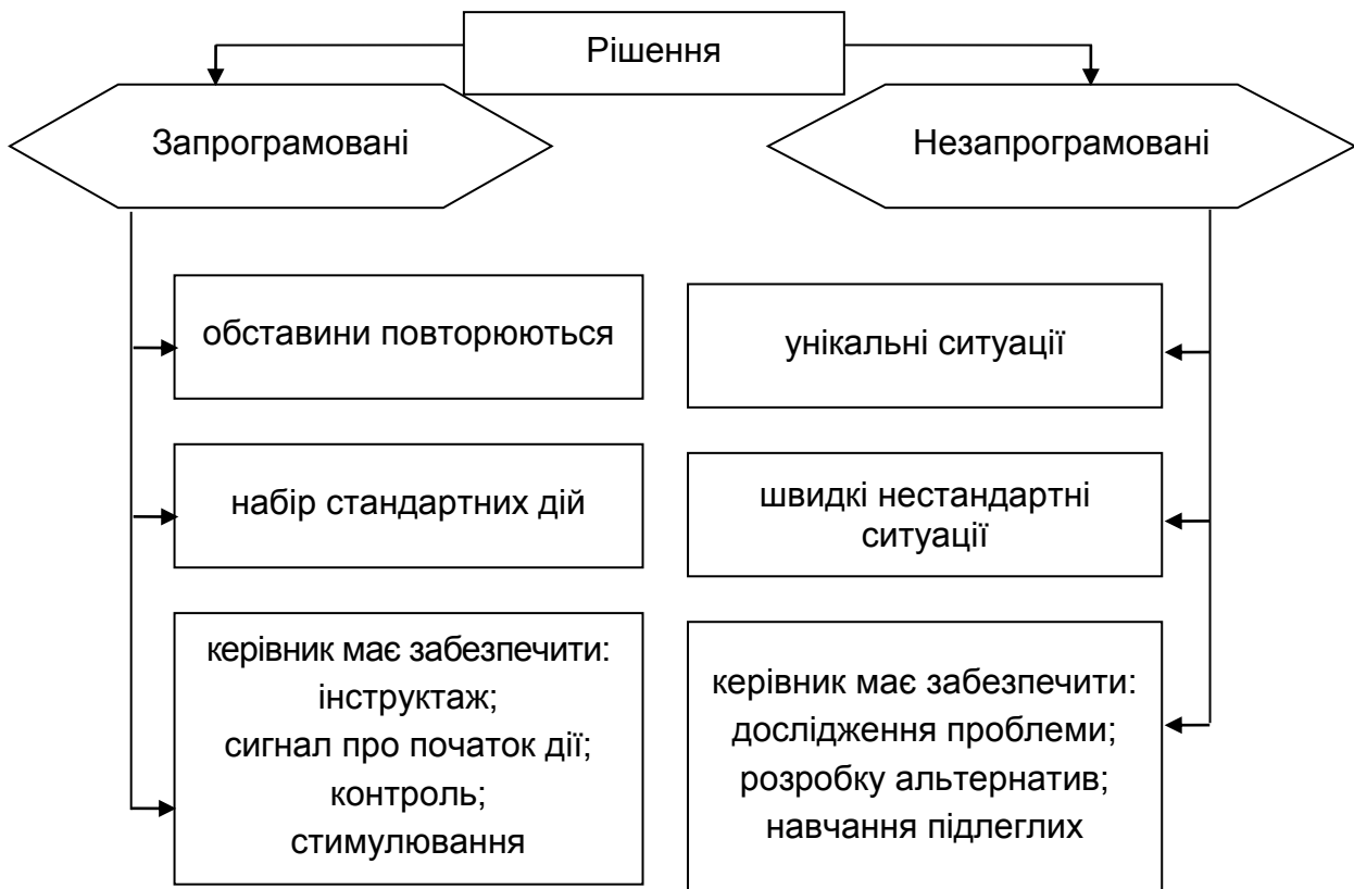
Рис. 2. Рішення за ступенем зумовленості [1]

потребують нестандартних ситуативних підходів до розв'язання проблем (рис. 2).