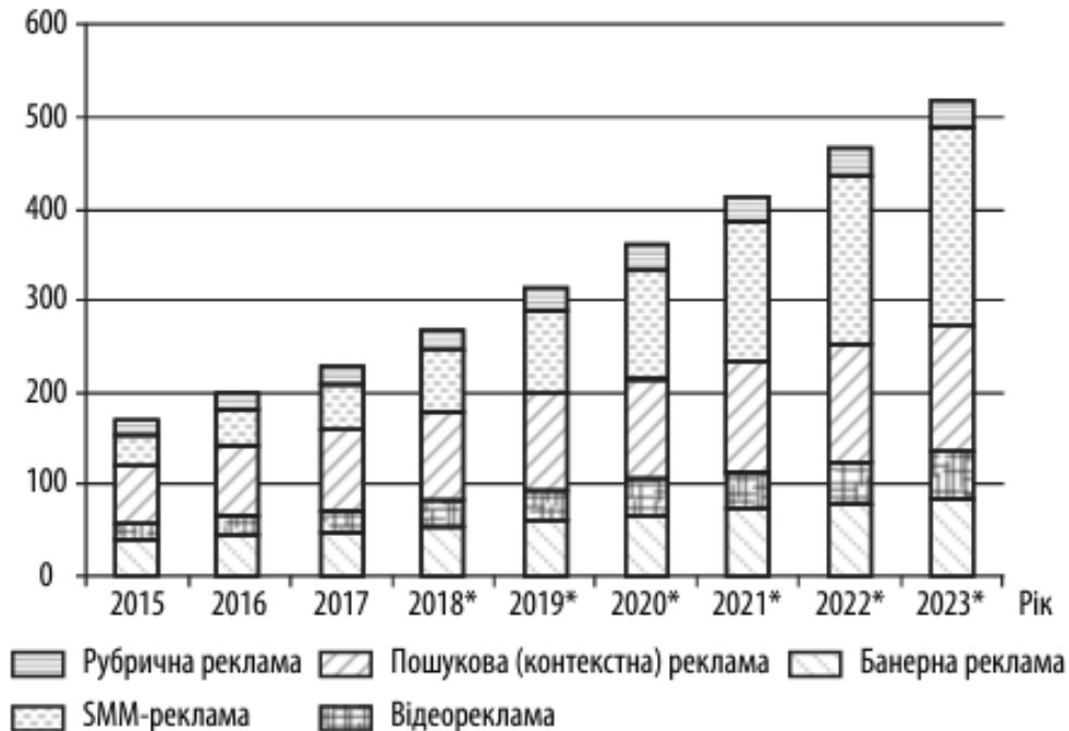
Рис. 1. Аналіз динаміки розвитку світового ринку рекламної діяльності у 2015–2023 рр.

Далі проведемо аналіз динаміки розвитку світового ринку рекламної діяльності у 2015–2023 рр. за допомогою сайту Statista (рис. 1).