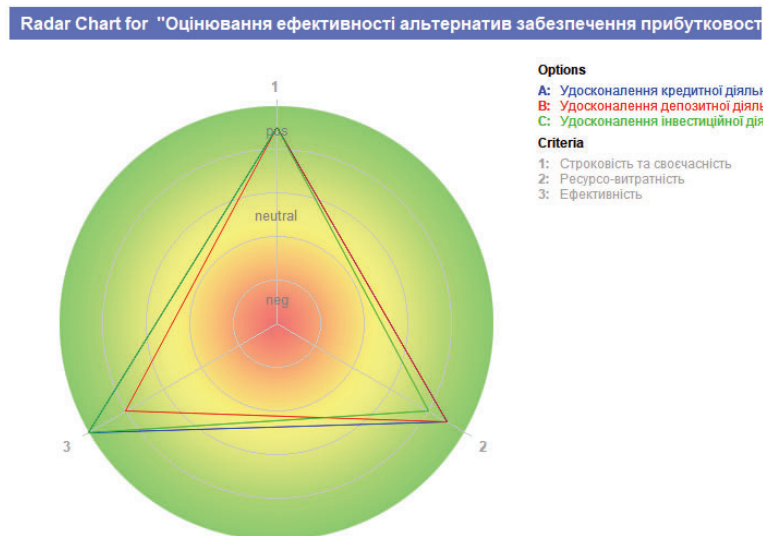
Рис. 2. Підсумкове вікно з результатами в Decision Making Helper щодо ефективності альтернатив забезпечення прибутковості діяльності банку (метод радару) (побудовано із застосуванням Decision Making Helper за джерелом [3])

Вірогідність прийняття рішення в розрізі А «Удосконалення кредитної діяльності банку» становить +80 %, для рішення В «Удосконалення депозитної діяльності банку» це значення дорівнює +68 %, а для рішення С «Удосконалення інвестиційної діяльності банку» - +76%. Визначено, із застосуванням СПП Decision Making Helper, що удосконалення кредитної діяльності банку є найбільш пріоритетним з огляду на рекомендацію рішення як найбільш позитивного. Однак, всі три альтернативи забезпечення прибутковості мають високу пріоритетність, що більше 50 %.