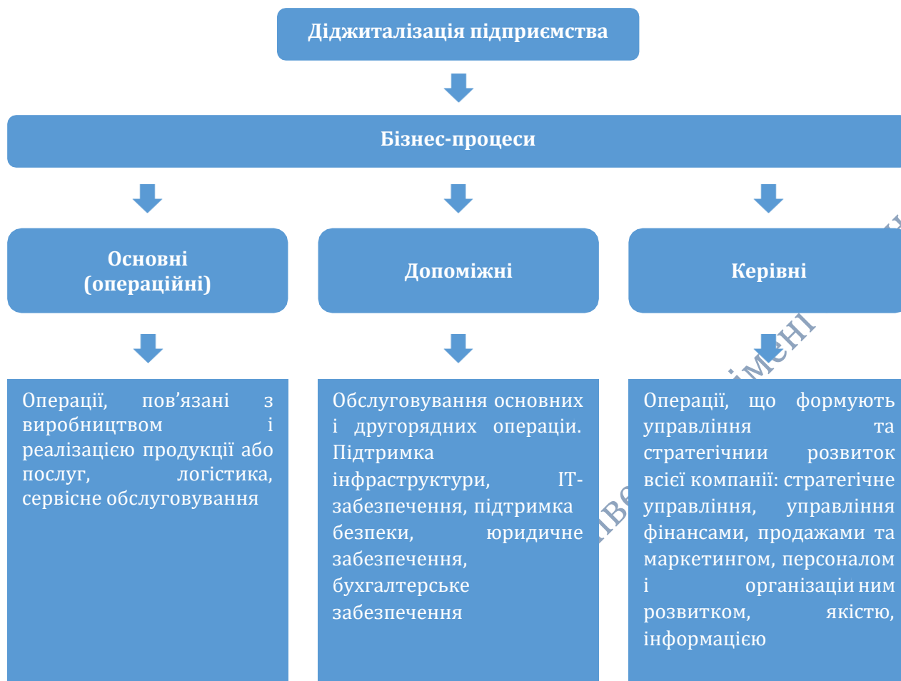
Рис. 1. Бізнес-процеси на шляху до успішної діджиталізації

Шевченко О. Л. та Стрілець А. Ю., досліджуючи питання діджиталізації підприємств, розділили бізнес-процеси на три основні складові, які наведено на рис. 1.