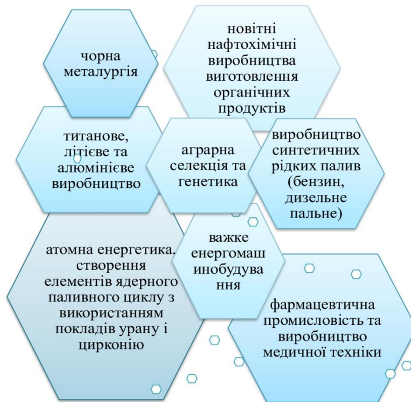
Рисунок 1. Перспективні галузі післявоєнного відновлення національної економіки України на якісно новій інноваційній основі.

За даними НАН України найбільш перспективними галузями післявоєнного відновлення національної економіки на якісно новій інноваційній основі, що забезпечить відповідний рівень зайнятості є: атомна енергетика, металургійний комплекс, виробництво медичної техніки та фармацевтична промисловість, агропромисловий комплекс, нафтова і нафтопереробна промисловість, паливно-енергетичний комплекс.