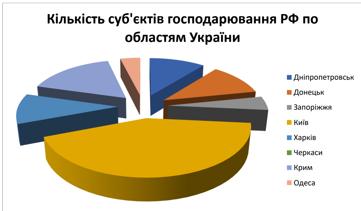
Рисунок 4. Кількість суб'єктів господарювання РФ за областями України, станом на травень 2022 року.

За даними російського Єдиного реєстру юридичних осіб в Україні у квітні працювало 104 філії російських компаній, у 2020 році – працювало 13 тисяч компаній, які мали російських засновників або бенефіціарів, насьогодні – дані знайдені не були. Найбільша частка сконцентрована в Києві, а по регіонах – у Харківській, Одеській, Дніпропетровській, Запорізькій областях. У травні 2022 року фахівці центру YouControl дослідили 273 українські компанії та організації мають зв'язки з 251 російським підприємством, 40 українських компаній із проаналізованого переліку входять до відомих фінансово-промислових груп, або групи компаній. 100 компаній із проаналізованого переліку зареєстровані в Києві, 39- в окупованому Криму, понад 20 компаній – у Донецькій, Дніпропетровській та Харківській областях, 11 організацій – в інших регіонах України, а у Закарпатській і Тернопільській областях – не виявлено компаній, пов'язаних РФ [11].