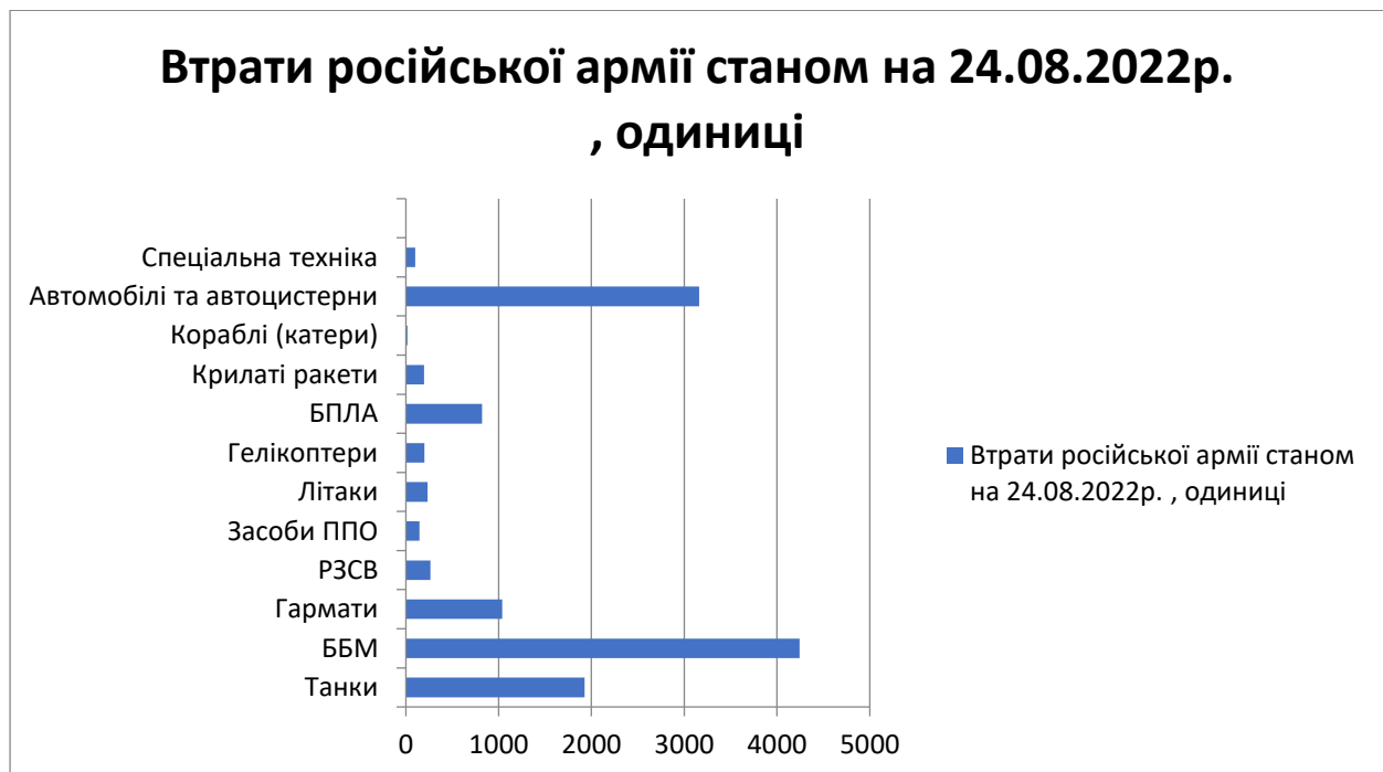
Рисунок 2. Втрати російської армії в період ведення бойових дій на території України за півроку, починаючи з 24.02.2022 року по 24.08.2022 рік.

За шість місяців втрати російської армії становлять 12 тисяч 142 одиниці техніки на 16,56 млрд доларів, серед яких: 1924 танків, 4243 ББМ ( бойових броньованих машин), 1036 гармат, 266 РЗСВ (реактивних систем залпового вогню), 147 засобів ППО (протиповітряної оборони), 234 літака, 199 гелікоптерів, 819 БПЛА (безпілотних літальних апаратів), 196 крилатих ракет, 15 кораблів (катерів), 3160 автомобілів та цистерн, 99 одиниць спеціальної техніки, 45700 осіб особового складу. Найбільшою втратою для Росії став флагман Чорноморського флоту ракетний крейсер Москва, його вартість 750 млн доларів, який Україна відправила на дно у середині квітня 2022 року