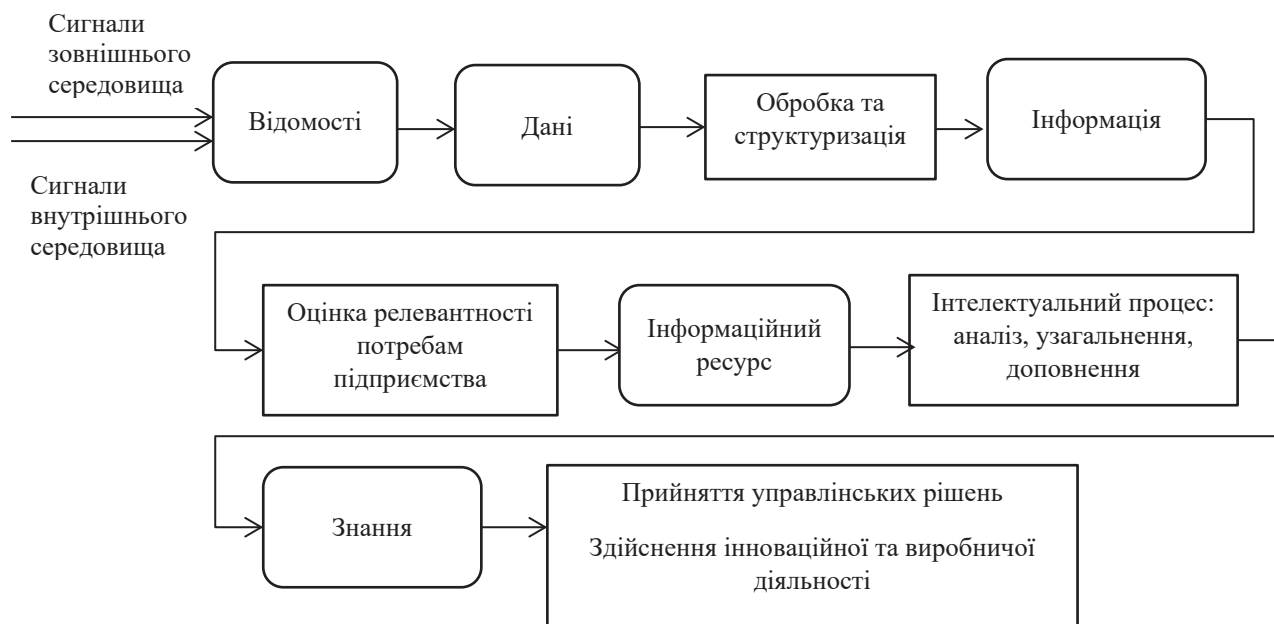
Рис. 1. Схема трансформації інформації в знання

живання Витрати на формування інформаційного ресурсу як самостійного продукту, призначеного для реалізації, мають бути відображені в якості продукції підприємства.