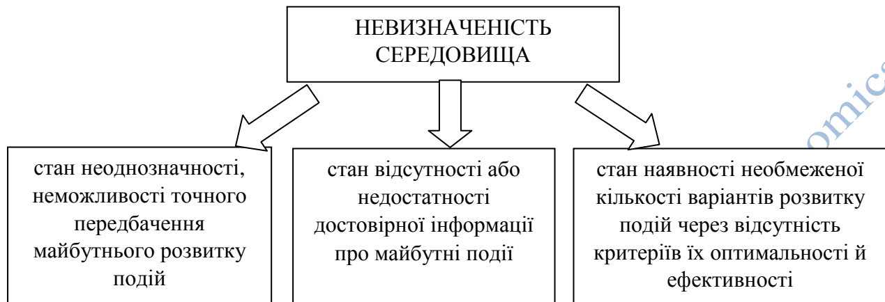
Рисунок 1. Фактори формування невизначеності середовища

Ґрунтуючись на проведеному дослідженні сутності дефініції «невизначеність» та її характеристик, можна сформулювати фактори формування невизначеності середовища (рисунок 1).