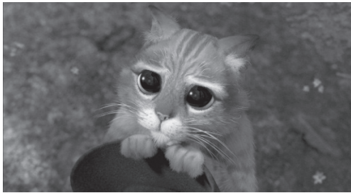
Рис. 2. Вхідне зображення

Очевидно, що для порівняння зображень необхідно, перш за все, використовувати низькі частоти. Розглянемо приклад роботи алгоритму попередньої обробки вхідного зображення, представленого на рис. 2 [5].