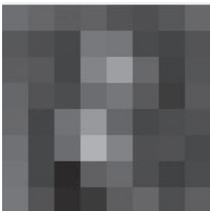
Рис. 3. Зменшене та знебарвлене зображення

Для позбавлення від високих частот зменшено вихідне зображення (відповідно до процедури хеш-методу). В даному прикладі зображення зменшується до розмірності 8x8. Зменшене зображення потім знебарвлюється (переводяться в градації сірого, що істотно скорочує розмір хешу). Зменшене і знебарвлене зображення представлено на рис. 3.