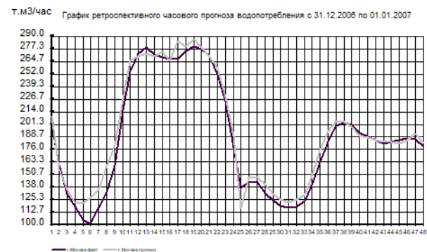
Рис. 2. Графік ретроспективного прогнозу годинного водоспоживання для випадку, коли дні 31 грудня і 1 січня розглядаються як нерегулярні

В цілому, механізм використання поняття нерегулярних днів при годинному прогнозі дозволяє отримувати прогноз з відносною середньою похибкою, що не перевищує 5%. Так на рис. 3 приведена гістограма відносних похибок (%) прогнозу годинного водоспоживання для випадку, коли 1 січня 2007 року розглядаються як нерегулярний день (див. рис. 2).