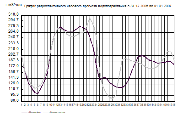
Рис. 1. Графік ретроспективного прогнозу годинного водоспоживання для випадку, коли дні 31 грудня і 1 січня розглядаються як регулярні

Як видно з рис. 1 та рис. 2 прогноз на дні 31 грудня і 1 січня у випадку, коли ці розглядаються як нерегулярні дні, значно кращий.