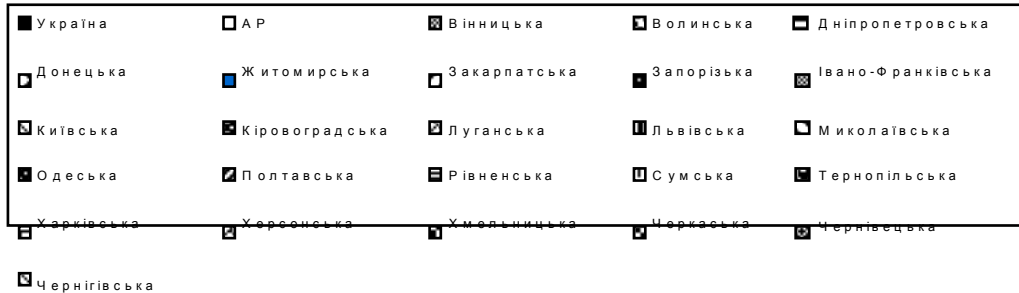
Рис. 2. Частка збиткових підприємств у загальній кількості підприємств у 2009 р.

Найбільше збиткових підприємств у 2009 році було в таких областях України, як: Волинська (53,5 %), Запорізька (49,8 %), Чернігівська (47,2 %), Житомирська (46,7 %). Найменше підприємств, що отримали збиток, у Закарпатській області (28,7 %) та Хмельницькій (29,7 %). Водночас у цих регіонах спостерігається менша кількість зайнятого населення. Це може бути наслідком ліквідації менш стійких підприємств у рік економічної кризи [3].