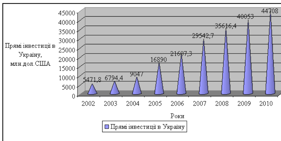
Рис. 2. Динаміка прямих інвестицій в Україну за 2002 – 2010 роки

Проаналізувавши динаміку прямих інвестицій в Україну, можна сказати, що відбувається тенденція зростання інвестицій в Україну. Так, у 2010 році порівняно з 2002 роком, їх обсяг збільшився майже у 8 разів, а саме на 39 236,2 млн дол. США, це свідчить про те, що Україна є досить привабливою для іноземних інвесторів. Для підтвердження цієї тенденції, динаміка прямих інвестицій в Україну зображена на рис. 2 [3].