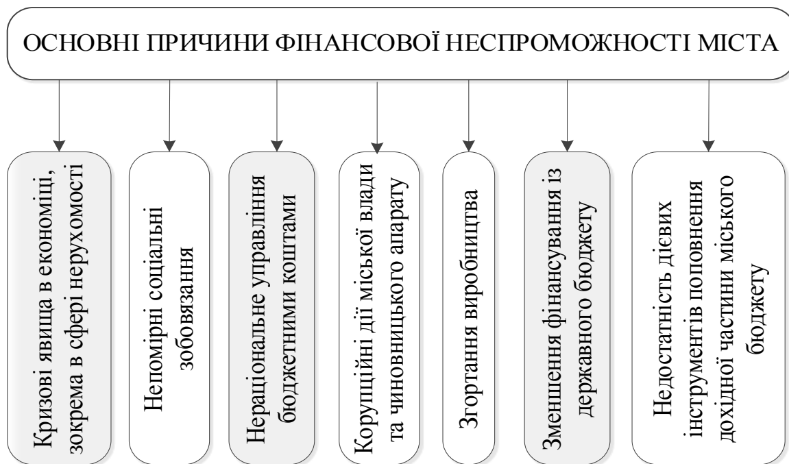
Рис. 1 – Основні причини фінансової неспроможності міст

Основні причини фінансової неспроможності міст узагальнено та наведено на рис. 1.