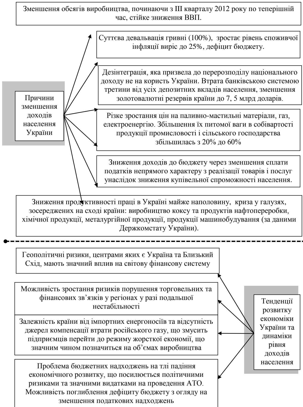
Рис. 3. Загальні причини та тенденції зміни рівня доходів населення