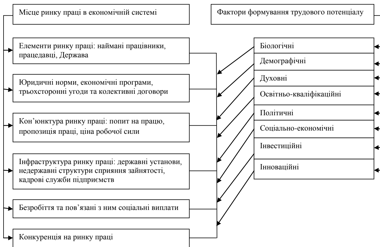
Рис. 1. Вплив ринку праці на формування трудового потенціалу

Напрями формування трудового потенціалу безпосередньо залежать від його елементів: демографічного, освітньо-кваліфікаційного, соціально-економічного та інших. Трудовий потенціал відтворюється за допомогою сім'ї, демографічної та освітньої політик держави, системи охорони здоров'я. На рис. 1 доведено, наскільки ринок праці впливає на формування трудового потенціалу.